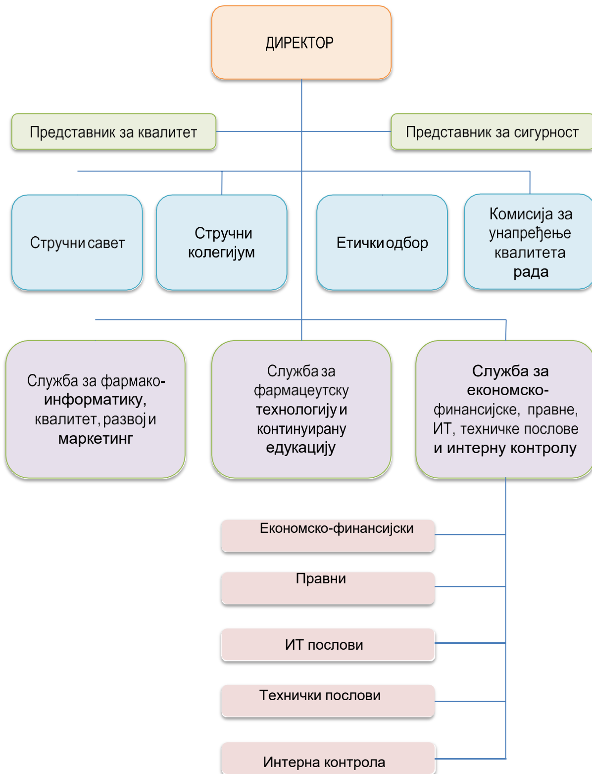
Слика 7. Шематски приказ управно-стручне организације ЗУ Апотека Пожаревац