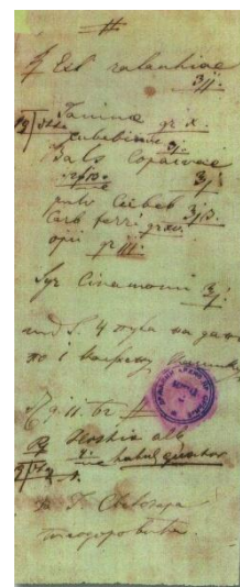
Слика 4. Оригинални рецепт из 1862. год.