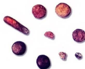
Слика 2. Инструменти и лековити облици из римског периода, пронађени на локалитету Виминацијума

Модерно апотекарство у Пожаревцу се везује за деветнаести век. Србија је у деветнаести век ушла без школованих апотекара и правих апотека. Услови за отварање апотека у Србији створени су тек доласком првих школованих фармацеута. Долазак првих школованих апотекара углавном се везује за велике универзитетске центре Аустро-угарске империје као што су Беч, Пешта, Будим, Праг и Грац.