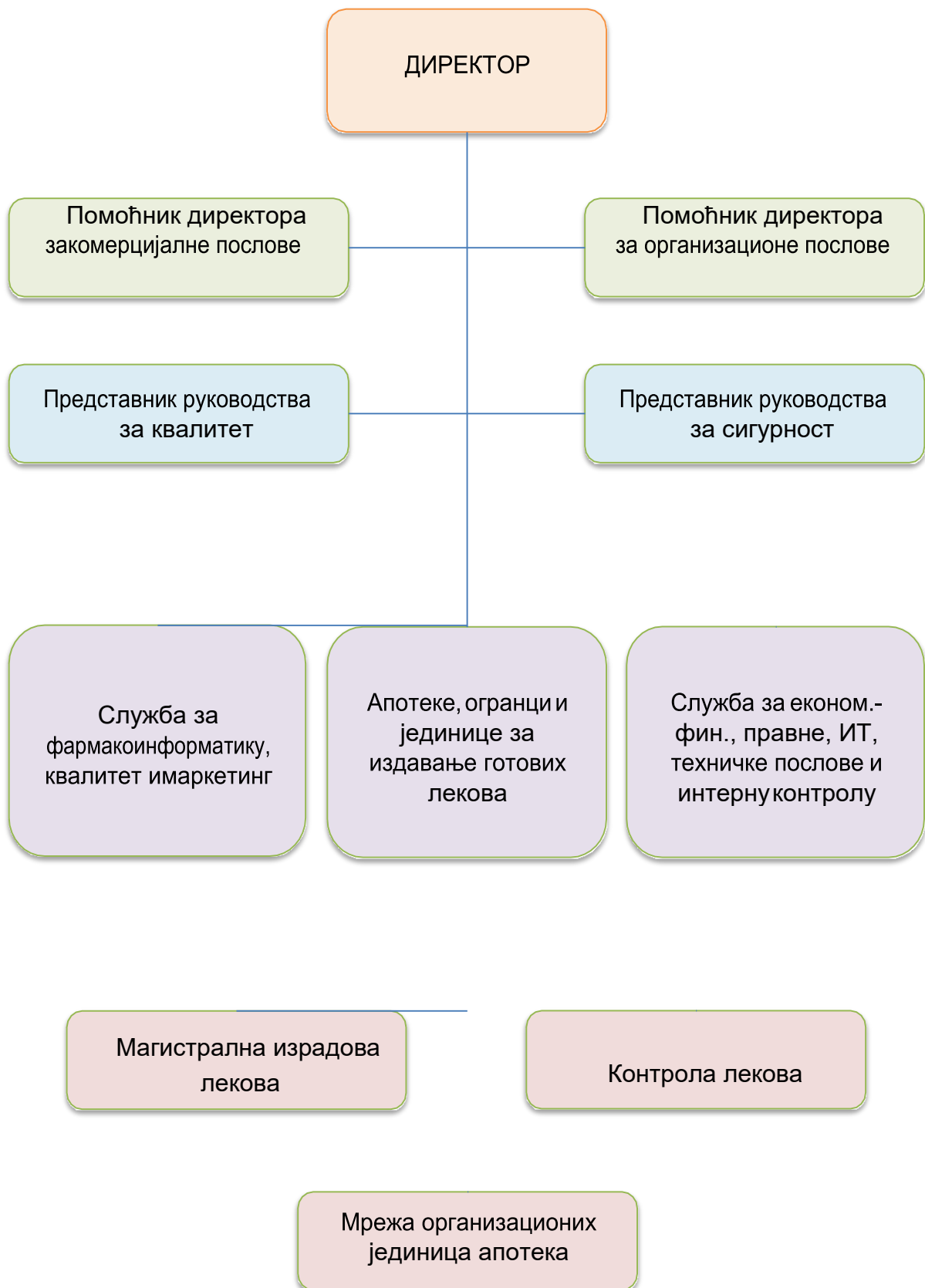
Слика 8. Редослед и међусобно деловање процеса детаљно је приказано документацијом система управљања квалитетом, укључујући критеријуме, методе и ресурсе неопходне за ефективно управљање и стално побољшање ових процеса