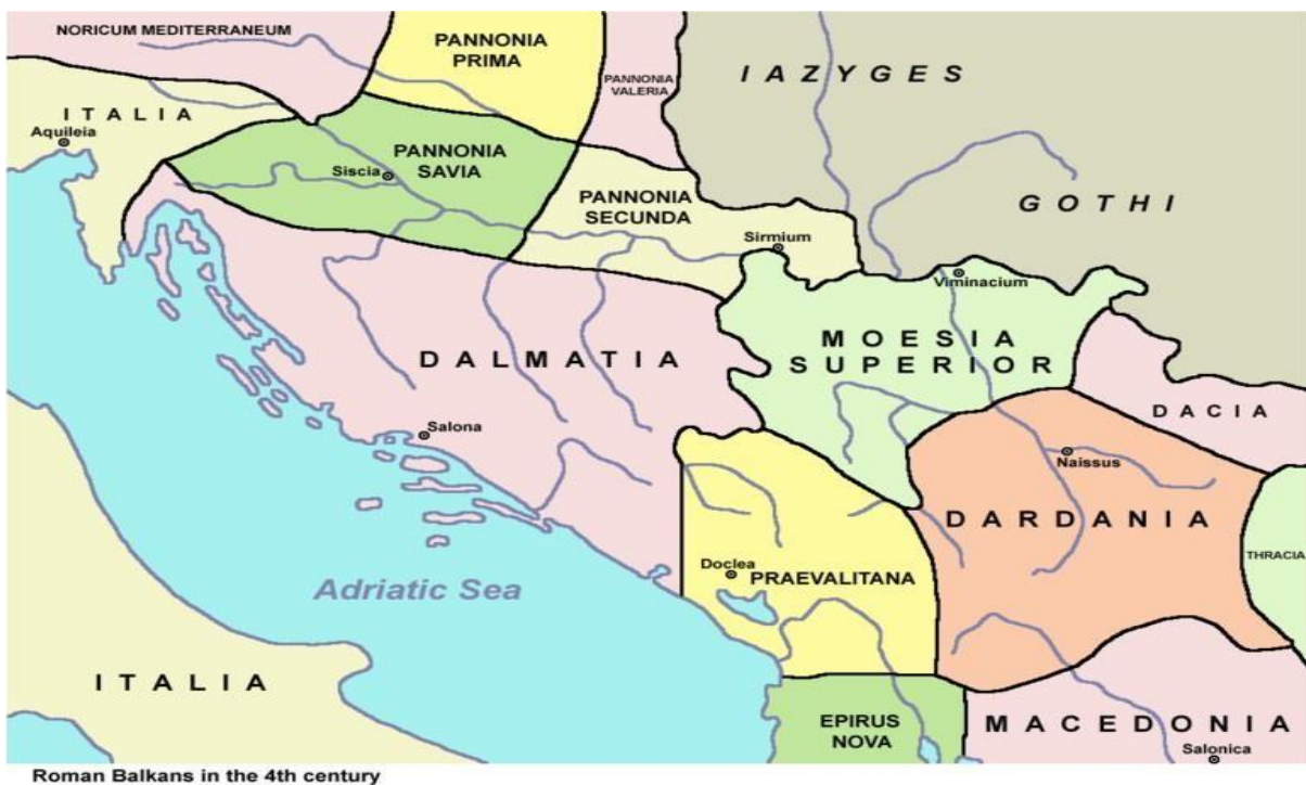
Слика 1. Просторна карта Балкана у четвртм веку.

Научна фармација га сматра оснивачем, па је самим тим и цела фармацеутска струка добила име Галенска фармација. То доказује да је вештина израде лекова, као што су лекови пронађени у Виминацијуму (налазиште надомак Пожаревца) били познати од давнина.