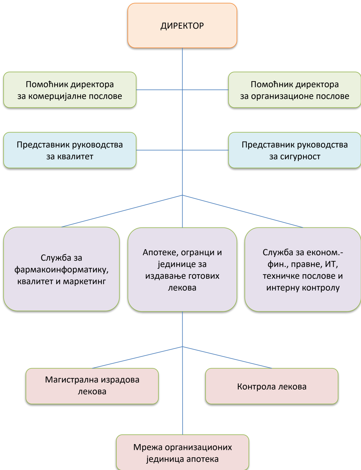
Слика 4. Редослед и међусобно деловање процеса детаљно је приказано документацијом система управљања квалитетом, укључујући критеријуме, методе и ресурсе неопходне за ефективно управљање и стално побољшање ових процеса