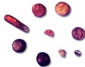
Слика 2. Инструменти и лековити облици из римског периода, пронађени на локалитету Виминацијума

Модерно апотекарство у Пожаревцу се везује за деветнаести век. Србија је у деветнаести век ушла без школованих апотекара и правих апотека. Услови за отварање апотека у Србији створени су тек доласком првих школованих фармацеута. Долазак првих школованих апотекара углавном се везује за велике универзитетске центре Аустро-угарске империје као што су Беч, Пешта, Будим, Праг и Грац.