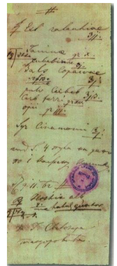
Слика 4. Оригинални рецепт из 1862.год.