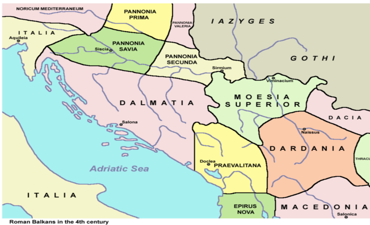
Слика 1. Просторна карта Балкана у четвртм веку.

Период у коме је радио лекароапотекар старог Рима везује се за рад једног од најславнијих лекароапотекара римске империје, а самим тим и целе историје - Галена.